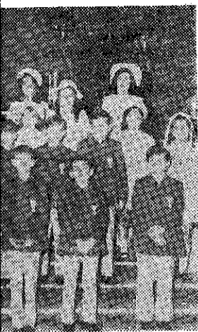
celebraron la Fiesta de la... del Domund

distribución de producto rati- da para combatir a los roedo- s que también se suman a s dolores de cabeza que nues- tros campesinos están actual- mente soportando. En este mes de octubre cobraron los agrí- colos las patatas que fueron entregadas al FORPA, y que por dicho organismo han sido bonadas al precio de tres pen- tas kilogramo.